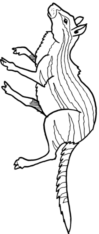
Archaeomeryx (40 cm)

Archaeomeryx var en underlig liten växtätare från Asiens stäpplandskap.